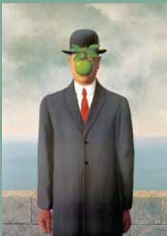
Rene Magritte, The son of man (1964)